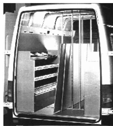
diverse aanpassingen in bestelauto's