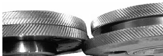
Snijdwalsen K9-AR, onmisbaar voor rationeel sloopwerk. Oude en/ of door storm beschadigde felsbanen kunnen simpel, snel en zonder beschadiging aan de onderconstructie gedemonteerd worden. (snelheid 9 m/min.)