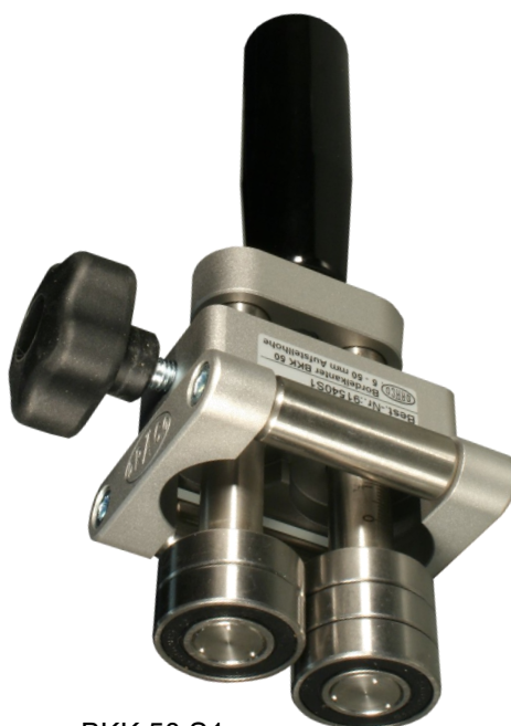
BKK 50 S1, met twee bovenbuiglagers