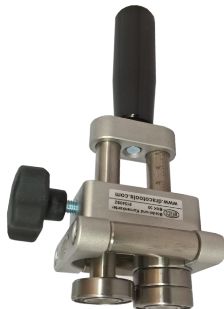
BKK 50 S2, met één bovenbuiglager