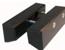
Stel kunststofgeleiders BG20065 voor het langs knippen van gegolfd materiaal