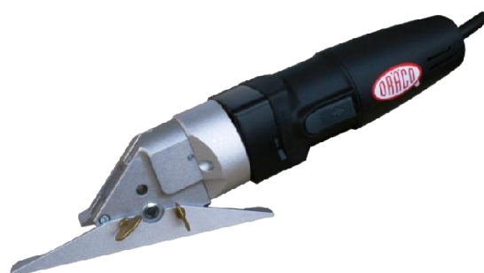
Inclusief zijaanslag voor het bijwerken van verlijmd plaat