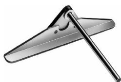
Strokensnijder S/02 Aanslag voor het knippen van parallelle stroken tot 100, 250 en 500 mm