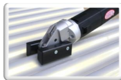
Langsknippen van gegolfd polyster met de optionele geleiders BG20065