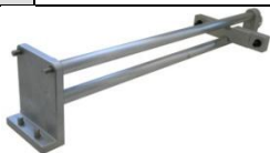
Adapter 91549 / 91549S3