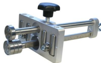
EcO-BenderS1 91545S1 (200 mm, ohne O-Griff) EcO-BenderS4 91545S4 (350 mm, ohne O-Griff)