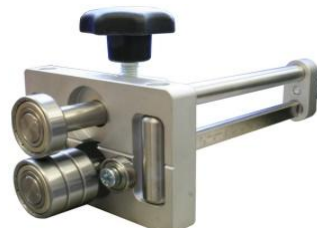
Mini-Bender 200 91544 / Mini-Bender 350 91544S3