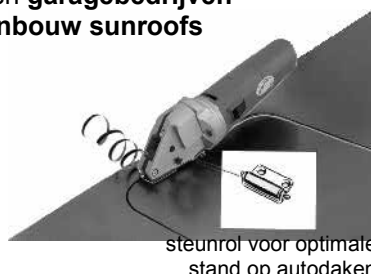
steunrol voor optimale stand op autodaken