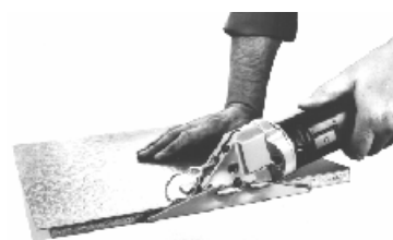
bijwerken van verlijmde formica platen