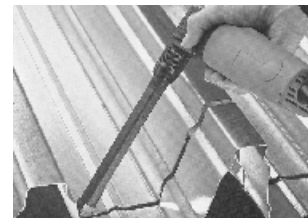
met profiel-set 160