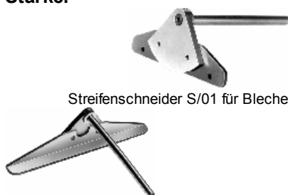
Streifenschneider S/01 für Bleche