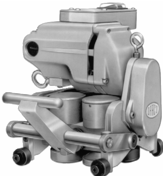
K9-GWS und K9-DSAR