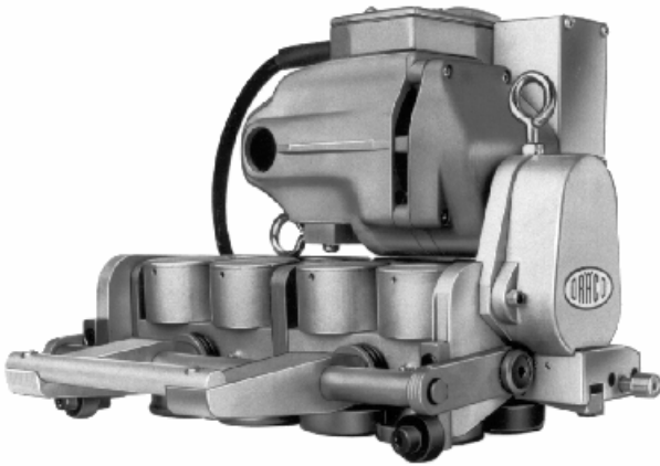
K9 mit Funktionsschalter K9-DF