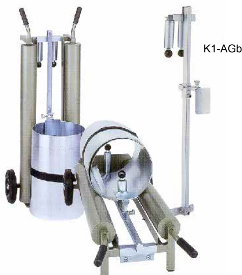
K1-AG mit K1-AGb