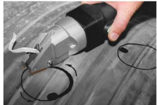
Aussparungen: Startloch vorbohren 12-14 mm Ø, Schneiden auf Anriss