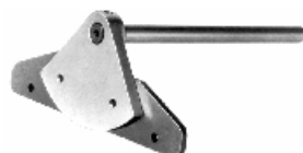
Streifenschneider S/01 Anschlag zum Schneiden paralleler Streifen bis 100, 250 und 500 mm